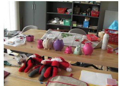
▲アクティビティセンターで利用者さんが作成された作品