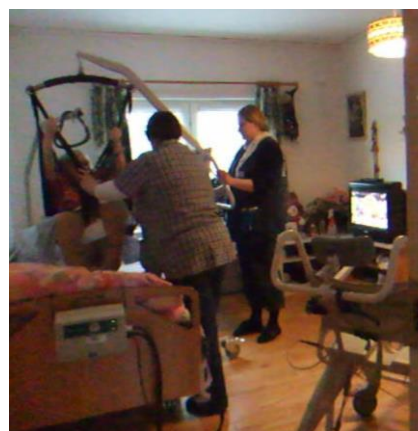
▲移乗には必ずリフトが使われている

中央厨房センター 介護福祉士養成校 補助器具センター 高齢者センター 在宅訪問介護に同行