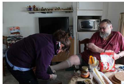
▲ヘルパーに同行して、実際の住宅での介護の様子を見学